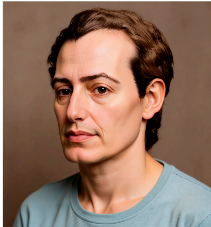
Imagem gerada por IA

As filmagens devem acontecer a partir de novembro de 2025, com a utilização de locações diversas no Rio de Janeiro, Petrópolis e Roma, e com a produção e distribuição da Imagem Filmes e Universal Pictures. A película conta também com o apoio da FEB Cinema (selo audiovisual da Federação Espírita Brasileira) e das produtoras associadas Patrícia Chamon e Patrícia Kamitsuji.