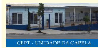
CEPT - UNIDADE DA CAPELA

CEPT JD. ITALIA / CAPELA Segunda a Sexta das 8h às 17h Fechado almoço das 12h às 13h