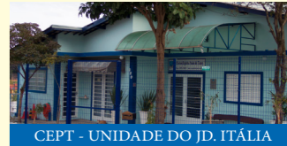
CEPT - UNIDADE DO JD. ITÁLIA