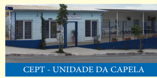
CEPT - UNIDADE DA CAPELA

CEPT JD. ITALIA / CAPELA Segunda a Sexta das 8h às 17h Fechado almoço das 12h às 13h