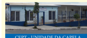
CEPT - UNIDADE DA CAPELA

CEPT JD. ITALIA / CAPELA Segunda a Sexta das 8h às 17h Fechado almoço das 12h às 13h