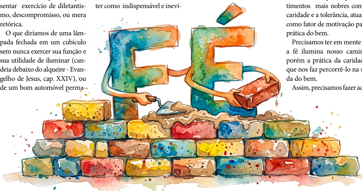
Imagens: Gemini/Imagem gerada por IA

Portanto, a fé é a “ferramenta” ou meio utilizado, devendo ter como indispensável e inevi-