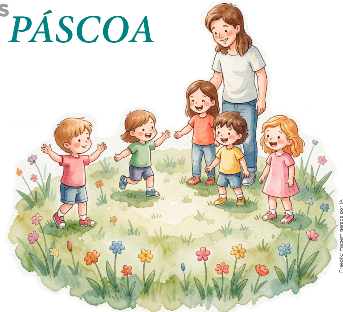
Freepik/imagem gerada por IA

Ansiedade, impaciência, falta de foco, angústia e depressão são alguns dos predicados que marcam a sociedade contemporânea em um nível tão intenso que podem ser descritos como os grandes males deste século. Aqui não cabe o julgamento do que está errado, por mais claro que possa estar diante dos olhos. Mas sim, um alerta para o que se pode fazer de certo a partir da força de vontade para mudar valores e praticar coisas boas.