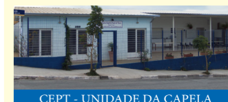
CEPT - UNIDADE DA CAPELA

CEPT JD. ITALIA / CAPELA Segunda a Sexta das 8h às 17h Fechado almoço das 12h às 13h