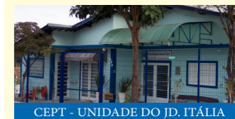
CEPT - UNIDADE DO JD. ITÁLIA