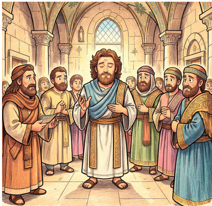
Freepik/imagem gerada por IA