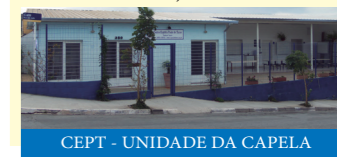
CEPT - UNIDADE DA CAPELA

CEPT JD. ITÁLIA / CAPELA Segunda a Sexta das 8h às 17h Fechado almoço das 12h às 13h