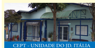
CEPT - UNIDADE DO JD. ITÁLIA